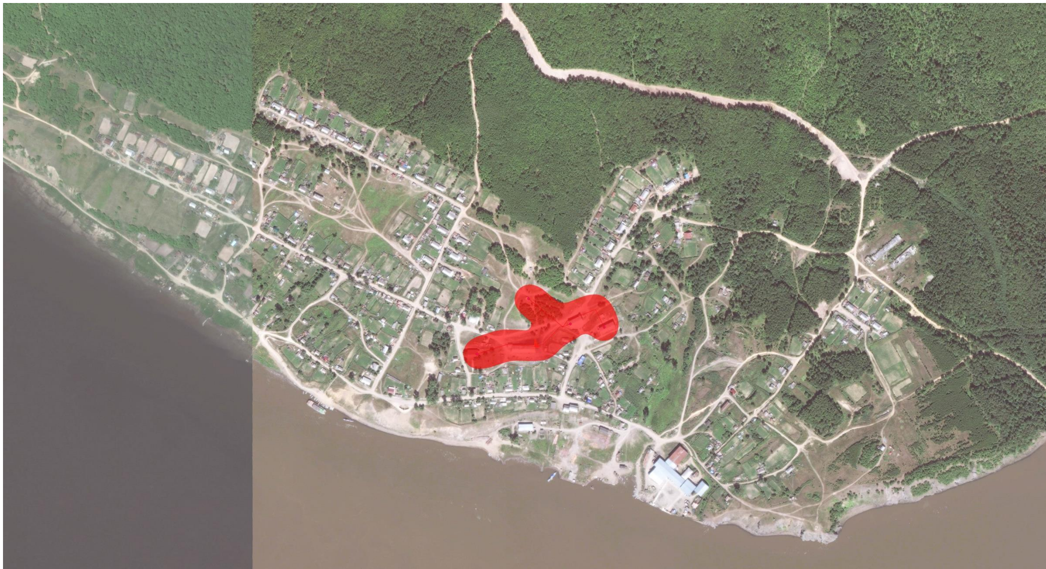
Рис. 2.1 – Зона действия системы теплоснабжения муниципального образования «Тырское сельское поселение».